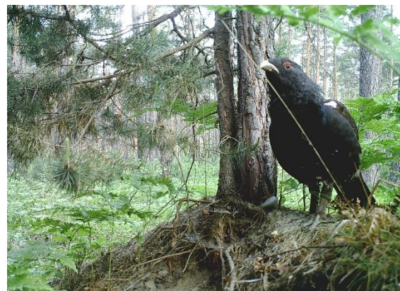
Abbildung 4. Junger Hahn ohne Kennringe (d.h. Tier stammt aus der Lausitz) (Liebenwerdaer Heide).

Ein weiterer Schwerpunkt unserer bisherigen Arbeit ist das Prädatorenmanagement. Für die Reduzierung von Fuchs und Waschbär haben wir dieses Jahr zunächst sechs Kunstbausysteme, sechs Hegerohre und zehn Holzkastenfallen beschafft (Abb. 5). Eine weitere Beschaffung von 30 Holzkastenfallen läuft aktuell. Mit der Bau- bzw. Fallenjagd soll erreicht werden, dass der Bestand an (durch ein Überangebot an Nahrung) stark geförderten, generalistischen Mesoprädatoren zumindest zeitweise und punktuell reduziert wird. Die Bejagung der Prädatoren soll den Aufbau einer tragfähigen Auerhuhnpopulation in der kritischen Anfangsphase erleichtern. Bisher arbeiten wir beim Prädatorenmanagement vor allem mit der Landesforst und einzelnen Privatwaldbesitzern und Jägern zusammen. Zukünftig werden wir