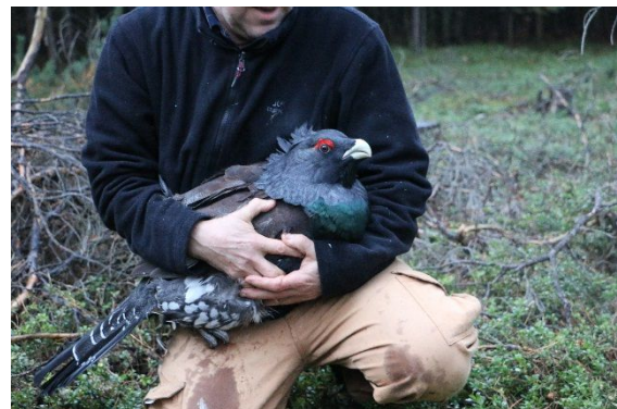
Abbildung 2. Hahn kurz vor der Freilassung im Waldgebiet Babbener Heide (Foto: A. Zimmermann).