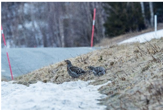
Abbildung 1. Hennen am Straßenrand im Fanggebiet Västerbotten.

Insgesamt haben wir dieses Jahr drei Fangaktionen durchgeführt. Im April fuhren wir in die schwedische Provinz Darlana, wo es an zwei Balzplätzen um den Fang von Hähnen ging. Im Mai folgte der Fang von Hennen an den Straßen der Provinzen Jämtland und Västerbotten (Abb. 1). Während der beiden Frühjahrsaktionen gelang uns der Fang von zwei Hähnen und 51 Hennen. Von diesen Tieren konnten wir einen Hahn und 50 Hennen erfolgreich auswildern. Während der Translokation im Mai erhielten wir zudem mehr als ein Duzend Eier, die während der Zwischenhälterung und des Transports gelegt wurden. Eine Züchterin schaffte es, aus diesen Eiern acht Jungtiere aufzuziehen (sechs Hähne und zwei Hennen). Aufgrund einer Pilzerkrankung und mangelnder Fitness gestaltete sich die Auswilderung der Jungtiere jedoch schwierig. Letztendlich überlebten von den acht Jungvögeln nur ein Hahn und eine Henne die erste Phase der Auswilderung. Um das Geschlechterverhältnis der freigelassenen Tiere zu verbessern, führten wir von Ende September bis Anfang Oktober eine dritte Fangaktion in der schwedischen Provinz Jämtland durch, in deren Verlauf wir fünf Hähne fangen konnten. Alle fünf Tiere wurden erfolgreich ausgewildert (Abb. 2). Schwerpunkt der diesjährigen Auswilderung war das Waldgebiet „Babbener Heide“ (sieben Hähne und 31 Hennen). Die anderen Tiere wurden auf die Waldgebiete „Weißhaus“ (16 Hennen) und „Weberteich“ (3 Hennen) verteilt.