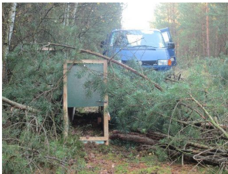
Abbildung 5. Eine von zehn Holzkastenfallen, die seit Herbst 2017 in Betrieb sind.

Natürlich ist eine auf das Auerhuhn angepasste Waldbewirtschaftung bzw. ein gezieltes Prädatorenmanagement nicht immer einfach in die Praxis umzusetzen. Um Schutzmaßnahmen auf großer Fläche zu etablieren, haben wir im Herbst 2017 die Gründung von zwei Arbeitsgruppen beschlossen. Die unter der Federführung der Landesforst gegründete Arbeitsgruppe „Waldbau“ wird sich mit der Konzeption und Umsetzung einer auf die Bedürfnisse des Auerhuhns angepassten Forstwirtschaft beschäftigen. Eine zweite Gruppe wird zum Thema Jagd bzw. Prädatorenmanagement arbeiten. Die aktive Arbeit und kollegiale Diskussion auch schwieriger Themen (Abb. 6) sind das Fundament für die Umsetzung von Schutzmaßnahmen für das Auerhuhn und vieler weiterer bedrohter Arten in unseren Wäldern.