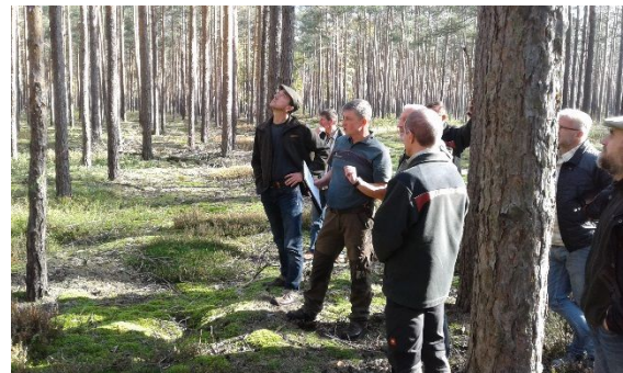
Abbildung 6. Exkursion ins Waldgebiet Weißhaus zum Thema Kiefernbuschhornblattwespe, Waldbau und Auerhuhn.

An dieser Stelle möchte ich mich bei allen bedanken, die aktiv zum Schutz der neuen Lausitzer Auerhuhnbestände beitragen und wünsche Ihnen eine besinnliche Adventszeit.